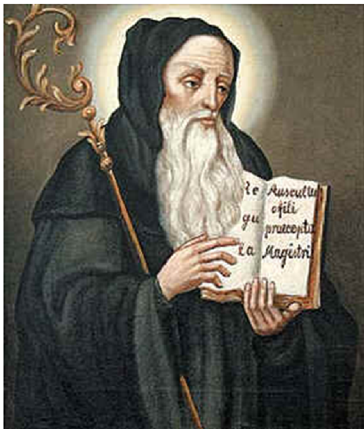
Święty Benedykt z Nursji

Jedną z takich nieprzeciętnych postaci był geniusz zachodniego Kościoła, św. Augustyn (354-430) biskup Hippony. W jego „Wyznaniach” znalazły się słowa,