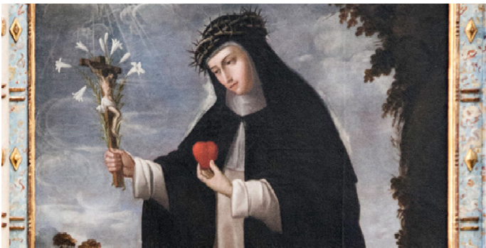
Św. Katarzyna ze Sieny

Charakter pięknej modlitwy ma tekst święta Katarzyny ze Sieny (1347-1380) , mistyczki naznaczonej stygmatami i bardzo mocno zaangażowanej w życie XIV-wiecznego Kościoła. Oto fragment jej „ Dialogu o Opatrzności Bożej ”, który można nazwać piękną modlitwą uwielbienia Trójcy Świętej: